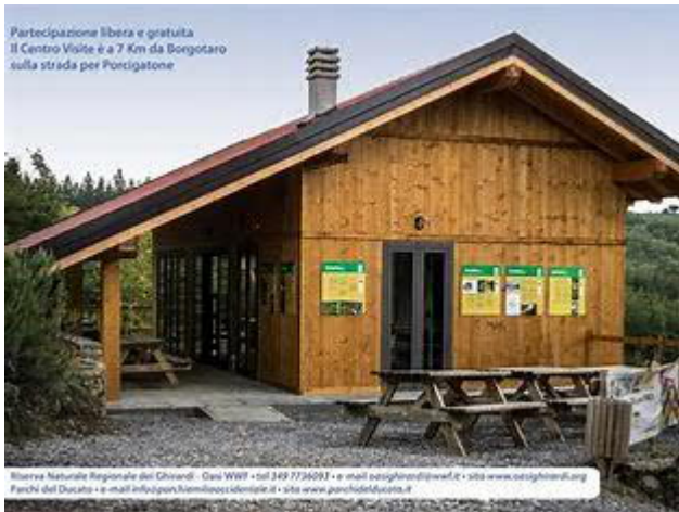
CHALET delle Predelle